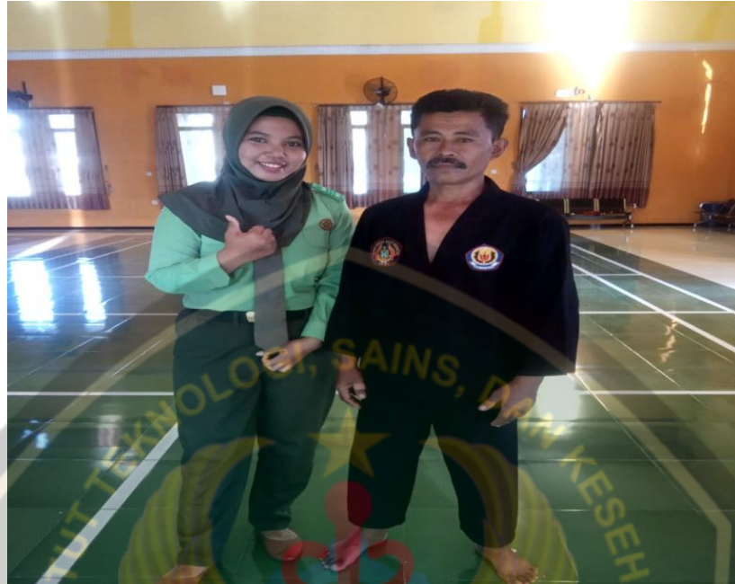
MEMINTA IZIN MELAKUKAN PENELITIAN