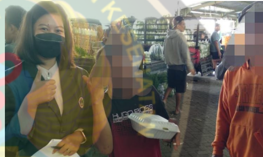
Gambar 4 Memberikan konsumsi untuk responden yang telah mengisi kuisioner