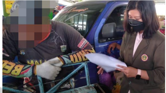
Gambar 2 Memberikan penjelasan kepada responden mengenai tata cara pengisian kuisioner.