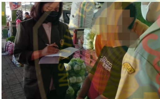
Gambar 3 Membantu responden dalam pengisian kuisioner.