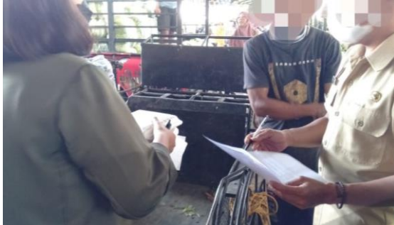
Gambar 1 Memberikan penjelasan kepada responden tentang maksud dan tujuan tentang dilakukannya penelitian.