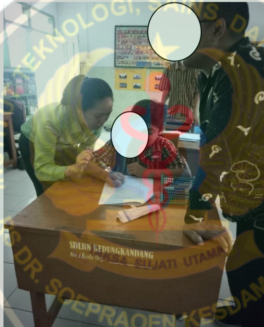
Menjelaskan Cara Pengisian Kuesioner