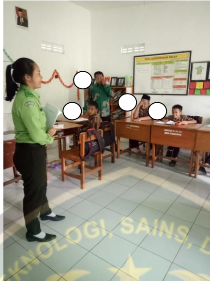
Menjelaskan Maksud dan Tujuan Penelitian