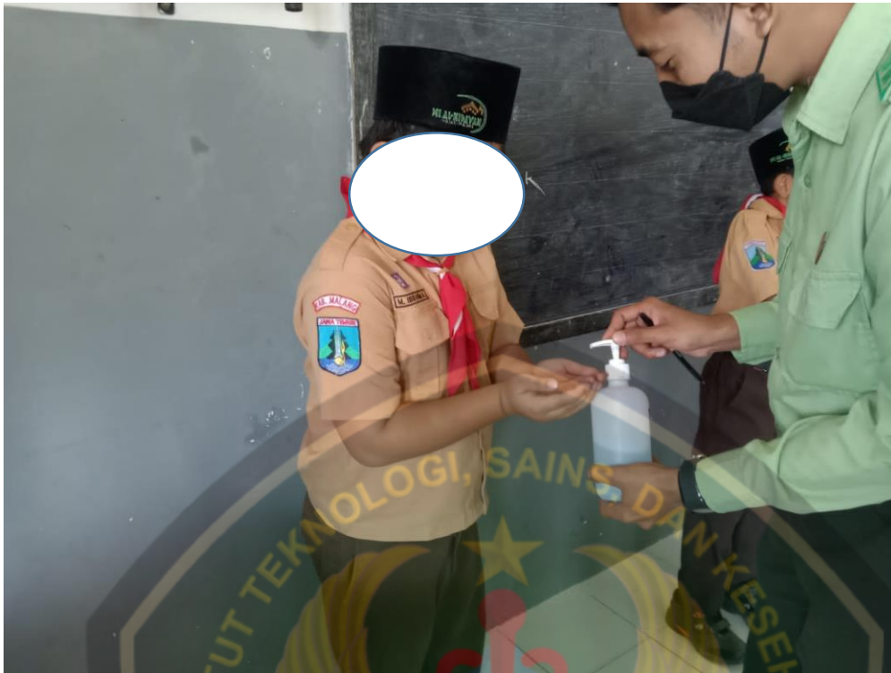
Sedang membagikan handsanitizer