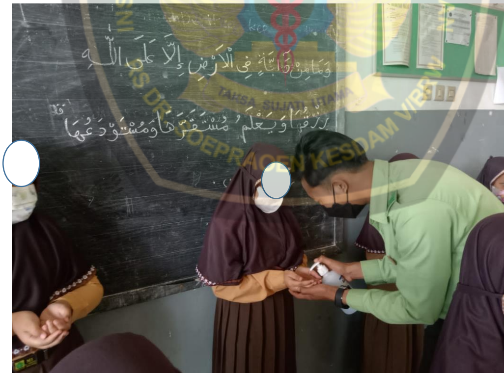
Responden mempraktekan cuci tangan