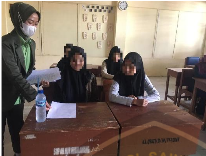
Peneliti membagikan kuesioner