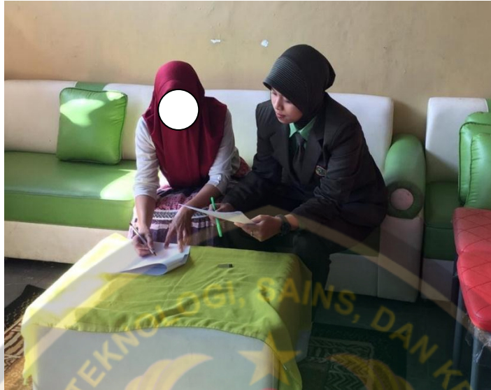
Memberikan Petunjuk Kepada Responden Dalam Mengerjakan Kuisisioner