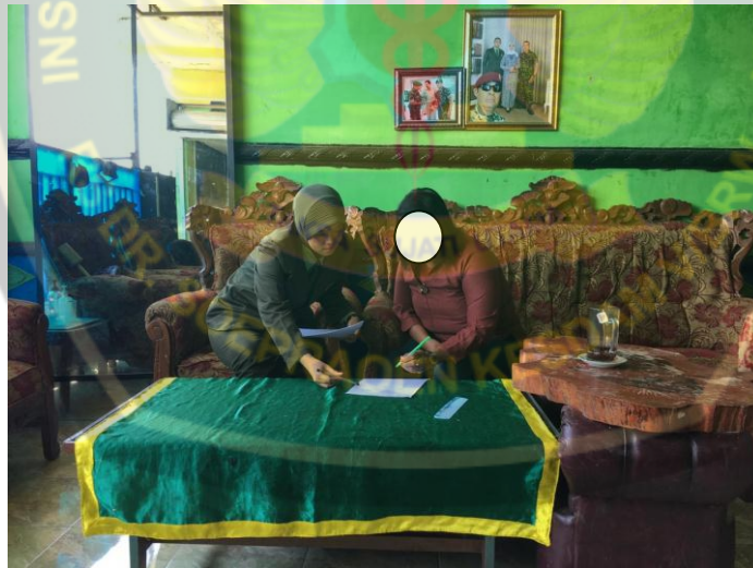
Mendampingi responden dalam Mengerjakan kuesioner