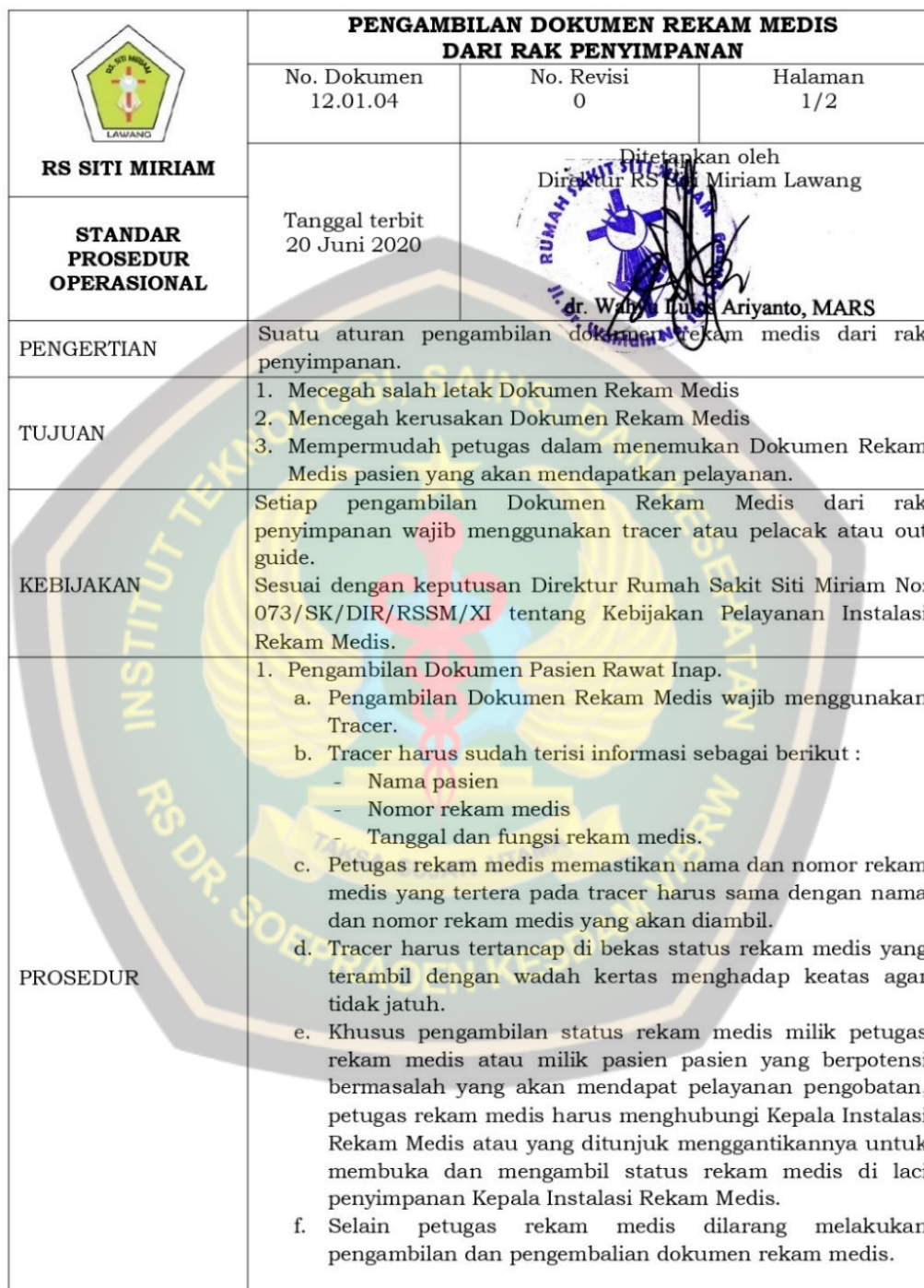
Lampiran 6. SOP Pengambilan Berkas rekam medis