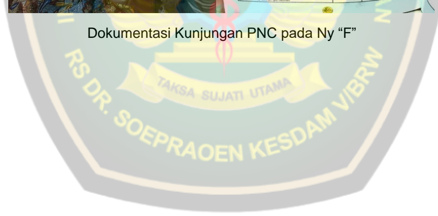
Dokumentasi Kunjungan PNC pada Ny "F"