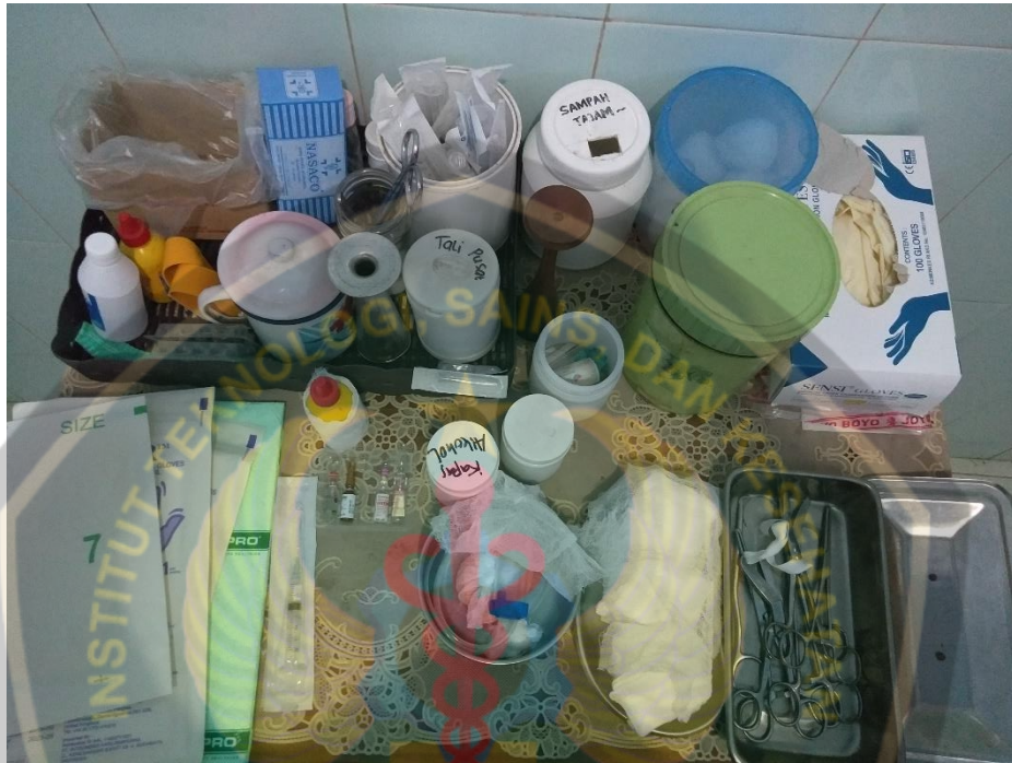
(Dok. Tanggal: Desember 2019 Jam : 13.00 WIB) Dokumentasi Persiapan Alat Partus