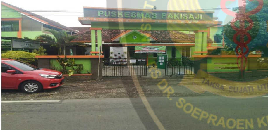
Lampiran 10 1Dokumentasi di Puskesmas Pakisaji