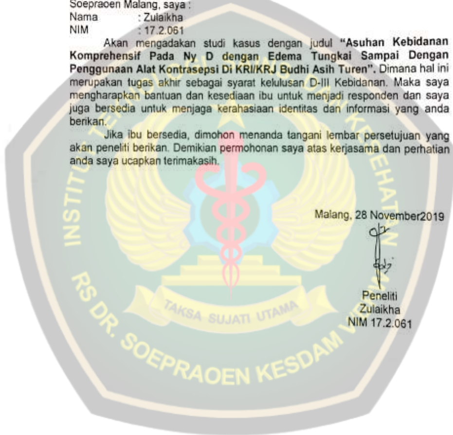
Peneliti Zulaikha NIM 17.2.061