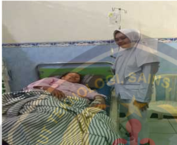
Dokumentasi ANC Ny "1"

(Dok. Tanggal: Senin, 25 November 2019, Jam: 17.00 WIB)