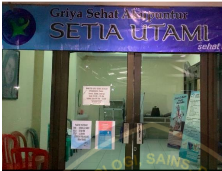
Tampak Depan Griya Sehat "SU"