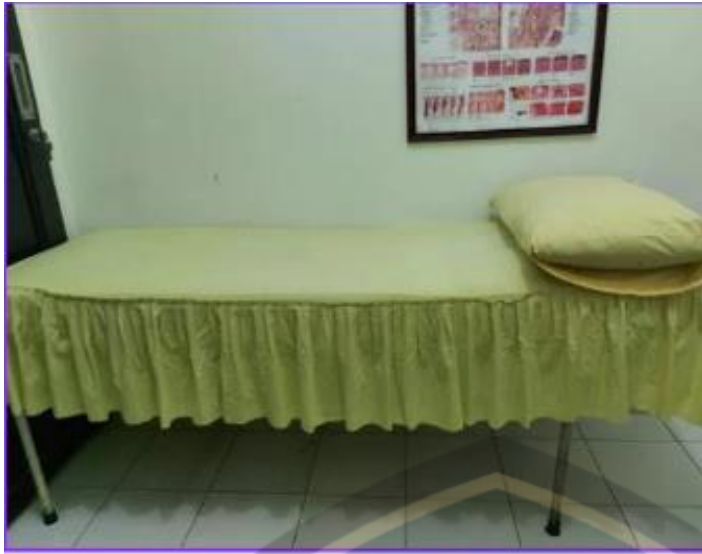
Ruang Periksa dan Terapi