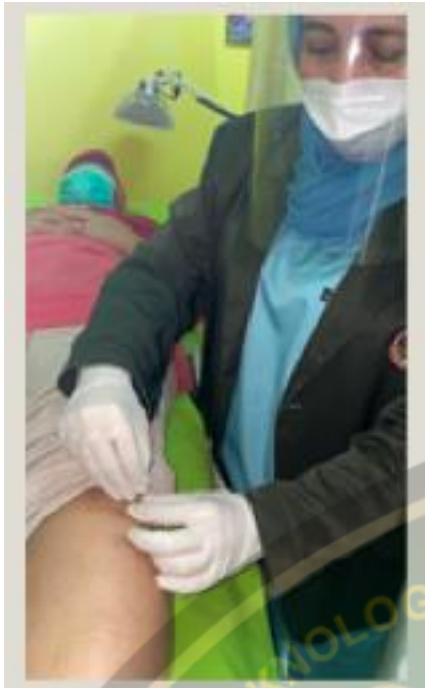
Proses Asuhan Akupunktur