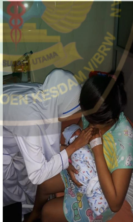
Dokumentasi nifas Ny. R