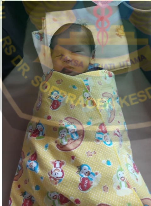
Dokumentasi BBL dan neonatus