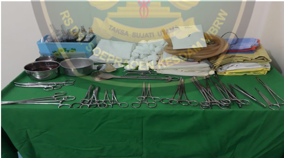
Dokumentasi Persiapan Alat Partus