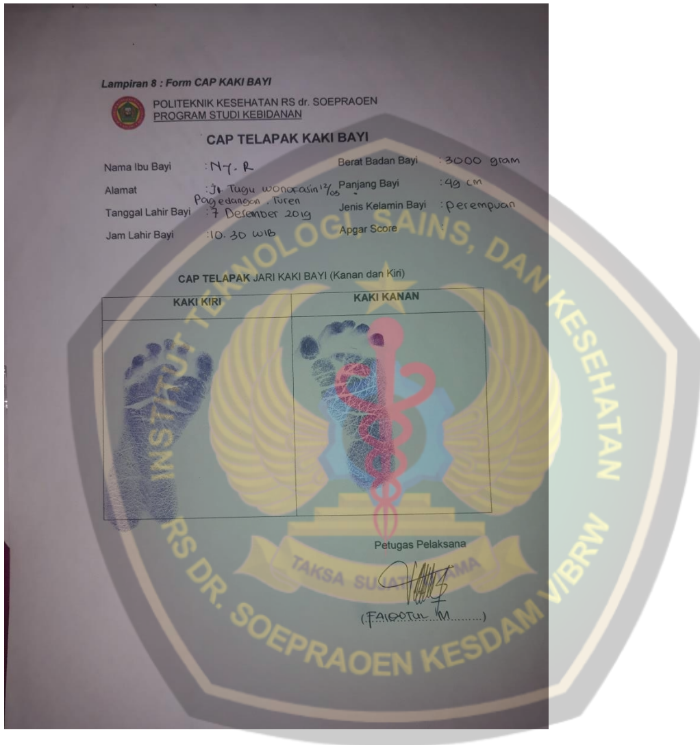
Dokumentasi cap kaki bayi Ny. R