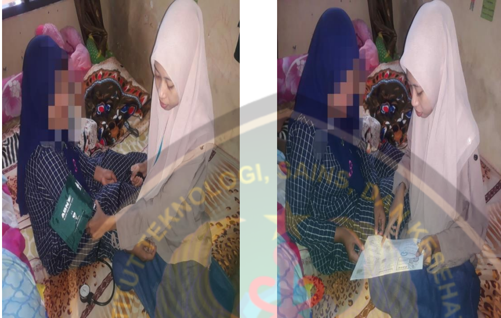
Dokumentasi kunjungan Nifas dan KB Ny. R

(Dok. Tanggal: Rabu, 15 Januari 2020, Jam: 10.00 WIB)