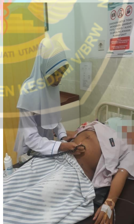
Dokumentasi ANC Ny. R