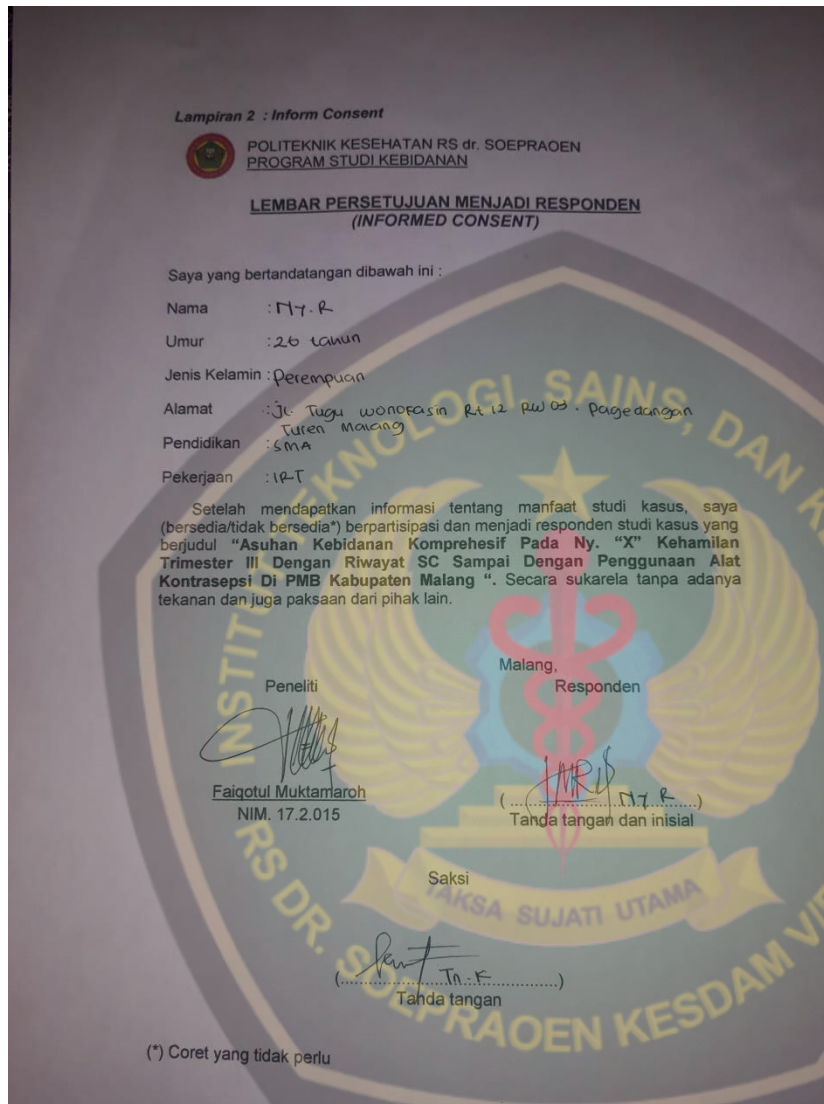
Lembar inform consent pada Ny. R