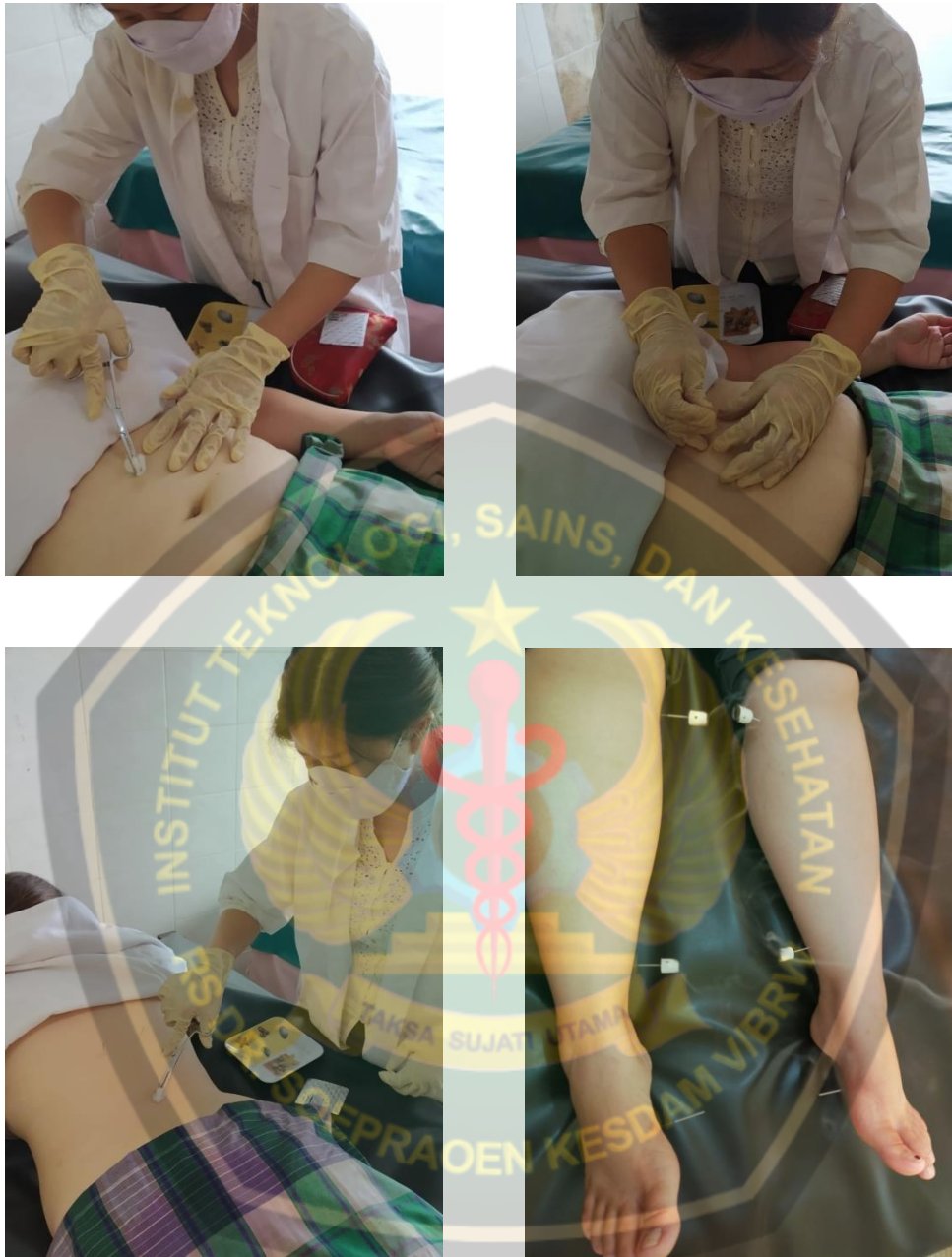
Asepsis Sebelum Penjaruman