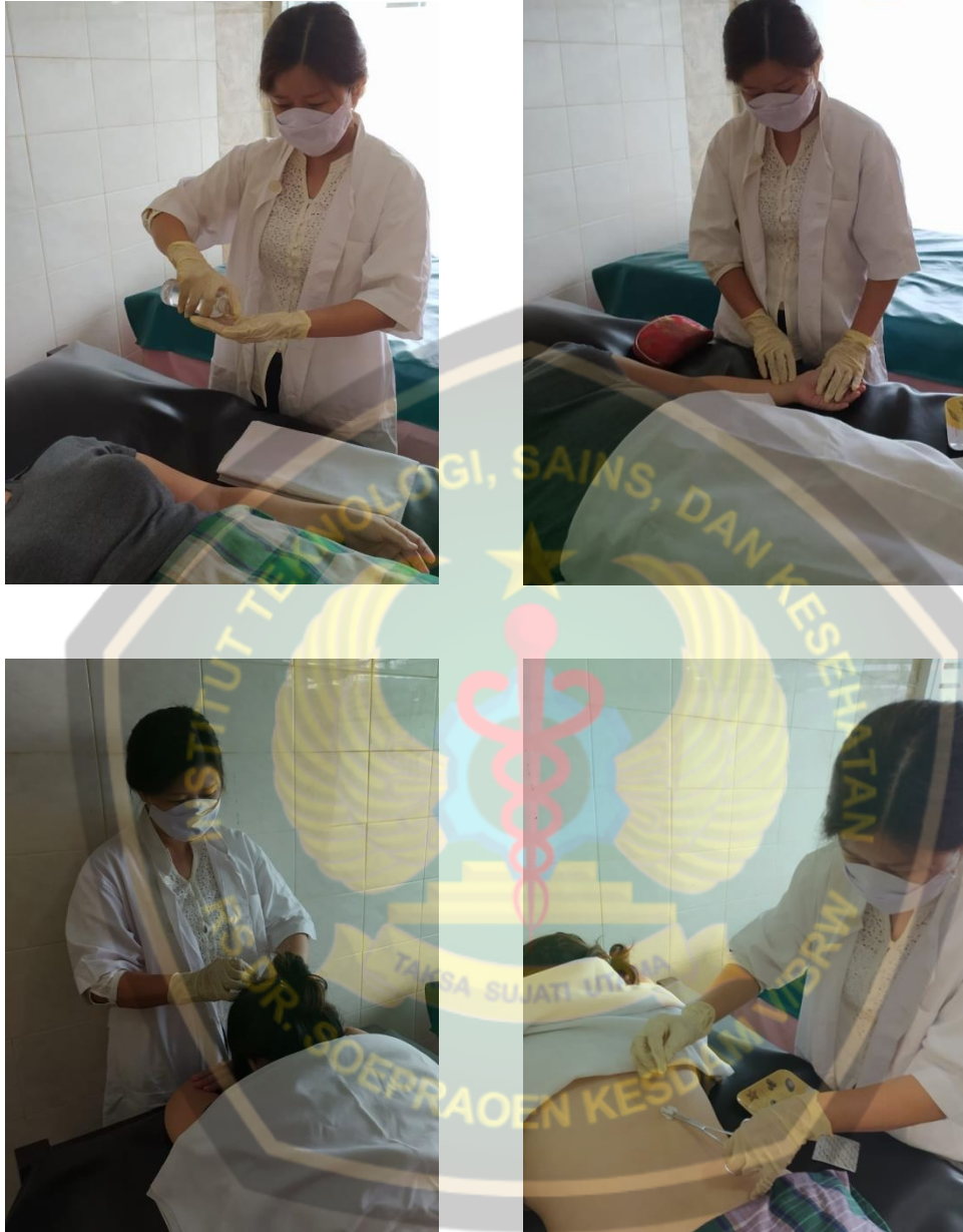
Kegiatan Asepsis dan Pemeriksaan