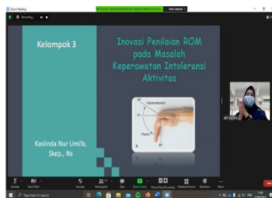
Gambar 2. Penyampaian materi oleh salah satu narasumber