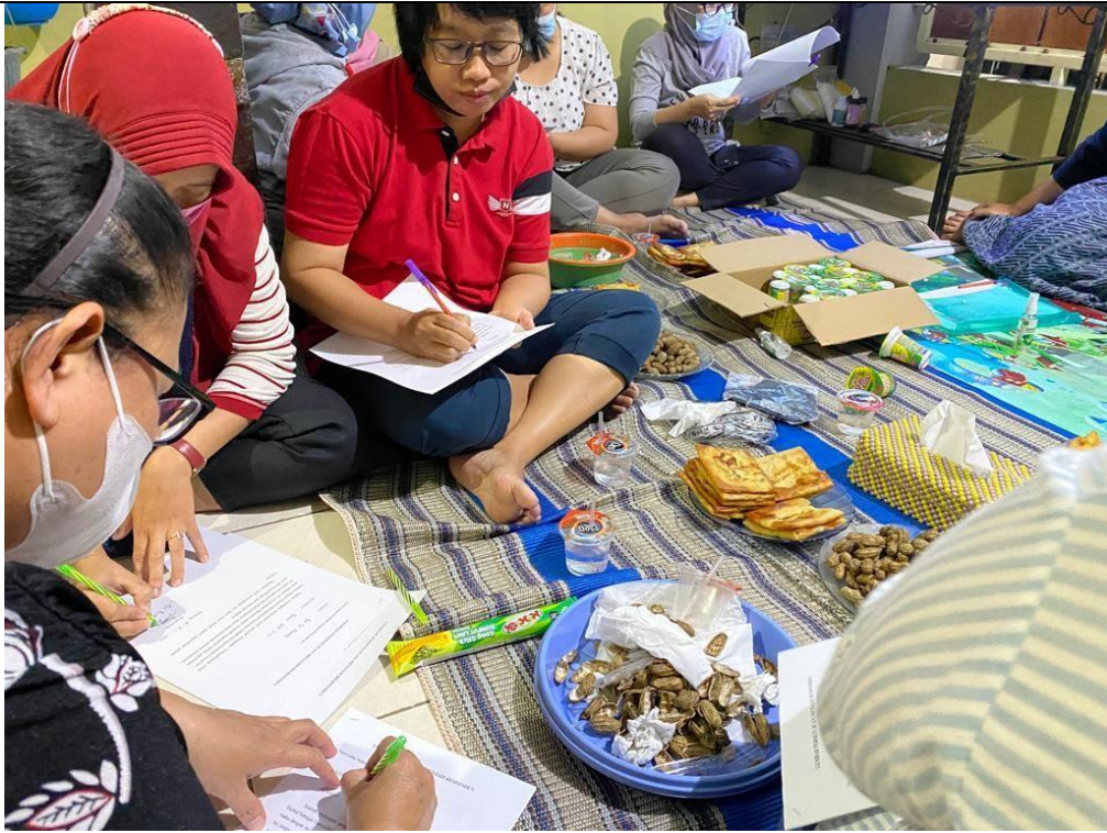
Sesi tanya jawab dengan masyarakat