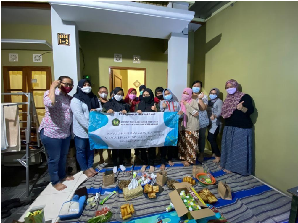
Pengabdian kepada masyarakat Perum Griya Tirta Aji, Sukun, Malang