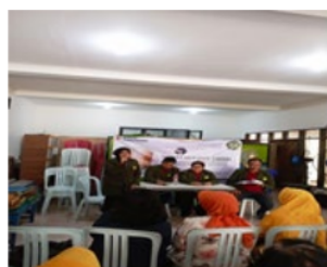
Gambar 2 Penyuluhan

pemaparan materi tentang apa itu osteoarthritis atau osteoarthritis beserta tanda gejala, penanganan pencegahan dan edukasi, serta pemberian praktek gerakan latihan berupa penguatan otot di area sendi lutut. Setelah dilakukan sesi tanya jawab, maka dapat diambil hasil pemaparan dan praktek latihan dari osteoarthritis adalah bahwa para lansia Sukrajaya Kelurahan Kertajaya, Kecamatan Gubeng, Surabaya dapat memahami tanda-tanda dan gejala osteoarthritis, cara awal menangani osteoarthritis, posisi yang baik supaya tidak mengalami osteoarthritis lebih lanjut, serta latihan yang dapat dilakukan bila telah mengalami osteoarthritis.