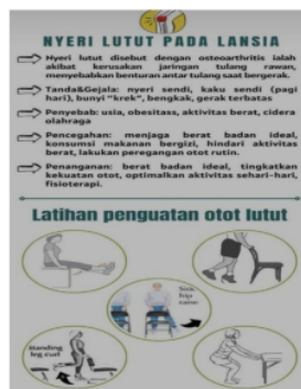
Gambar 3 Leaflet

Untuk gerakan latihan dari osteoarthritis atau osteoarthritis antara lain: