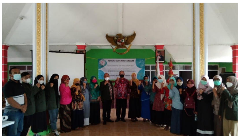
Gambar 4. Foto bersama dengan peserta pengabdian

Kegiatan pengabdian masyarakat dimulai dengan pemberian edukasi tentang suplemen kesehatan dalam menghadapi COVID-19. Materi edukasi yang disampaikan yaitu tentang pengertian dari suplemen kesehatan, tujuan penggunaan suplemen kesehatan, sistem imun, informasi tentang vitamin C, sumber-sumber vitamin C, bagaimana vitamin C bekerja untuk daya tahan tubuh, aturan di Indonesia terkait penggunaan vitamin C, pengertian COVID-19, serta upaya-upaya meningkatkan daya tubuh salah satunya dengan mengkonsumsi suplemen kesehatan.