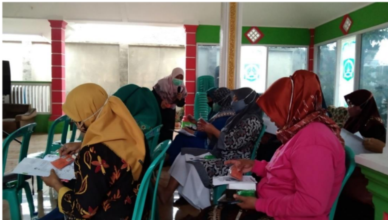
Gambar 2. Pemberian buku saku suplemen kesehatan dan vitamin C