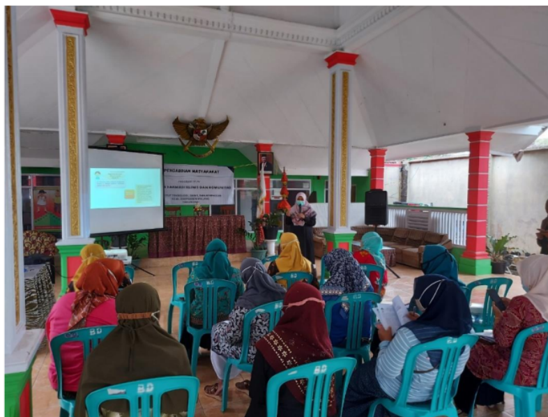
Gambar 3. Pelaksanaan edukasi tentang suplemen kesehatan