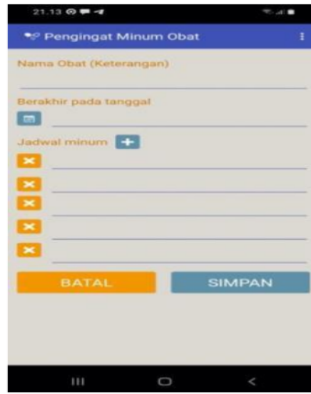
Gambar 4. Aplikasi pengingat minum obat.