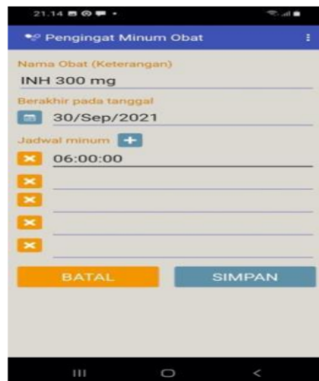
Gambar 5. Pengisian data obat, jadwal dan alarm di aplikasi pengingat minum obat