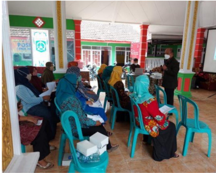
Gambar 2. Pelaksanaan pengenalan aplikasi pengingat minum obat desa Sumbersuko.