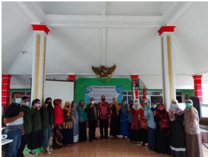
Gambar 3. Dokumentasi berakhirnya kegiatan pelatihan penggunaan aplikasi pengingat minum obat.