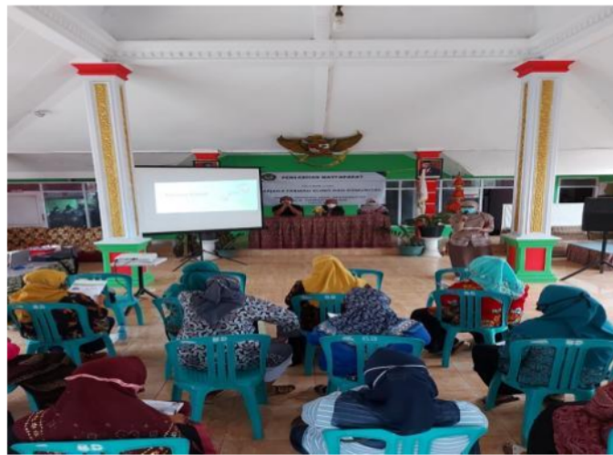
Gambar 1. Pembukaan pelatihan pengenalan aplikasi pengingat minum obat desa Summersuko.