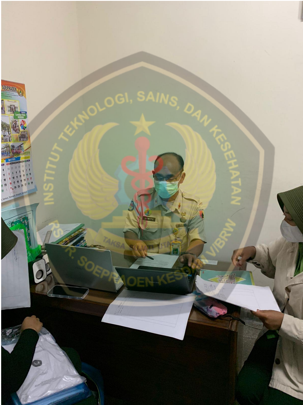
Lampiran 6. Dokumentasi Konsultasi